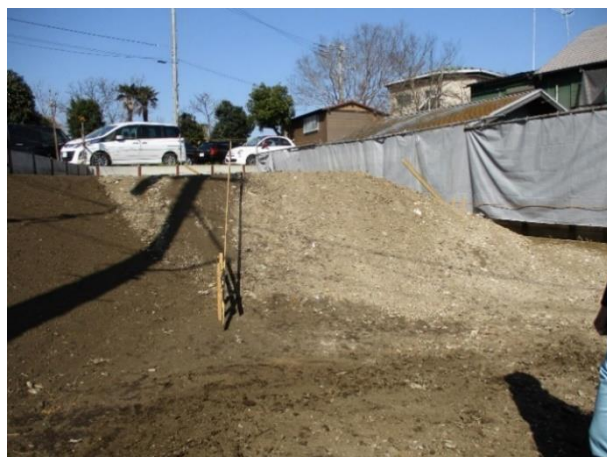
下寺尾 1824 番 5 (地点工)